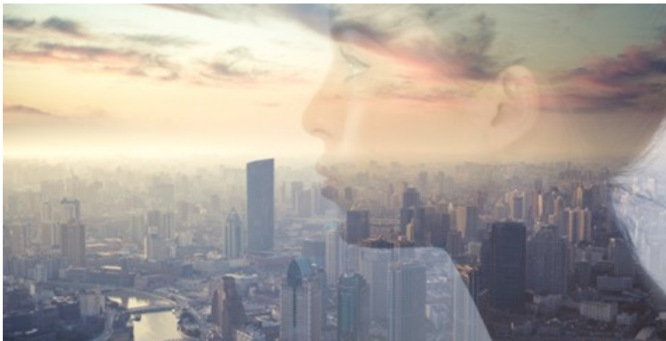
imagem. Dê uma olhada nas imagens abaixo para entender melhor o resultado.