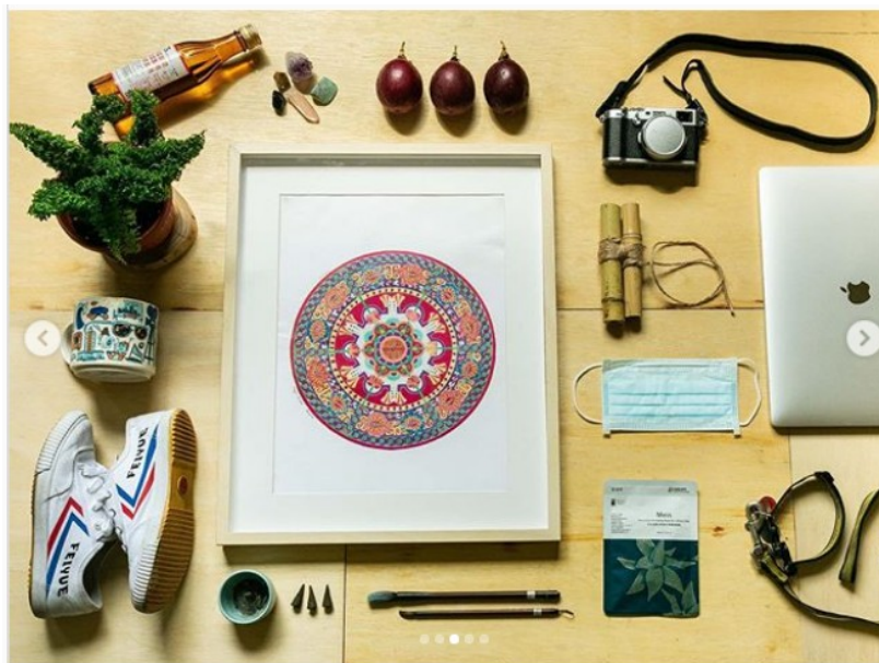
The Butlers, Portland Oregon

Então, o que é essencial para vocês nesse momento? Quais objetos vocês mais têm utilizado? Separem esses objetos (mínimo de 5, máximo de 15) e fotografe eles. Mas antes de tudo, leia com atenção essas indicações para fazer o trabalho: